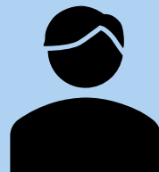
Referent*in für Öffentlichkeitsarbeit