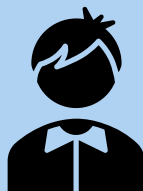
Beauftragte Frauen und Mädchen